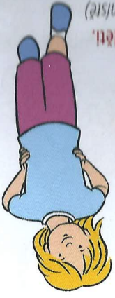
2 na louce si hraji děti. (poskakujeme na míste)