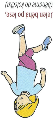
5 Jelen behá po lese, (běháme do kolečka)