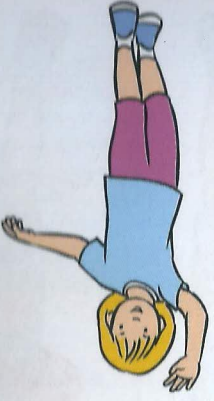
8 a mávají všem těm dětem. (mávdáme)