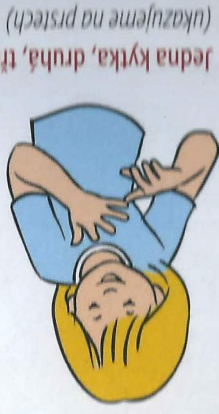
1 Jedna kytká, druhá, tretí, (ukazujeme na prstech)