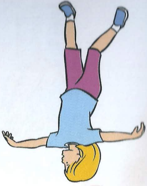
7 Ptáci leti širým světem (mávdáme rukama jako ptáci křidly)